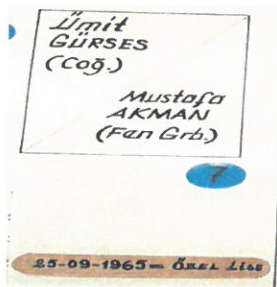
25 Eylül 1965(Özel Lise Dönemi) Ümit GÜRSEL(Coğrafya)